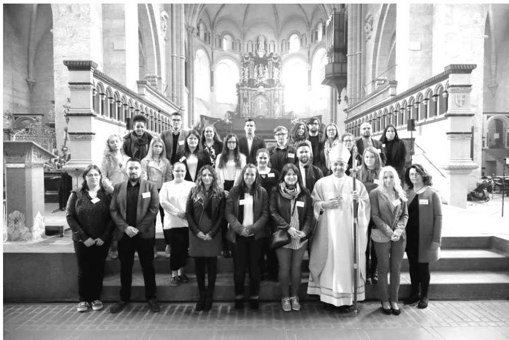
Text und Foto: Presseabteilung des Bistums Trier

selber zu seiner Stimme im Alltag zu werden“, gab Weihbischof Gebert den Firmbewerbern als Auftrag mit. Das Geheimnis des Geistes Gottes sei Vollmacht und Geschenk, aber auch Herausforderung in einer Zeit, in der Christen an vielen Orten der Welt Konflikten, Anfeindungen und Verfolgung ausgesetzt seien. Umso wichtiger sei es, in der Gemeinschaft zu leben, auf Gottes Stimme zu hören und gerade auch als Patinnen und Paten von den Spuren Gottes im eigenen Leben zu berichten. „So kann jeder von uns an seinem eigenen Platz Stimme Gottes und zu seinen Hände und seinen Füße in dieser Welt werden“, ermutigte der Weihbischof, bevor er den Frauen und Männern das Firmsakrament spendet.