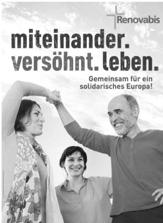
Pfingstkollekte am 20. Mai 2018

Wir treffen uns am Donnerstag, 10.05. um 05.45 Uhr an der Pfarrkirche in Langsur und pilgern nach St. Matthias. Dort feiern wir um 10.00 Uhr das Hochamt. Herzliche Einladung an alle Interessierten!